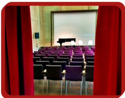
Salone dei Concerti in Castello Smilea

Si richiede inoltre di segnalare il repertorio da eseguire durante il corso.